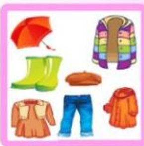
ЧТО ОДЕВАЮТ ЛЮДИ?