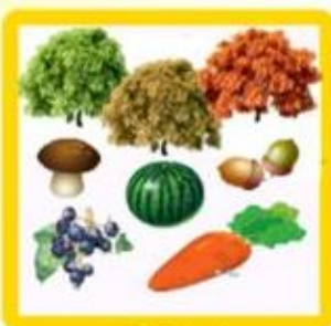
КАКОВ РАСПРЕДЕЛЕННЫЙ МОР?